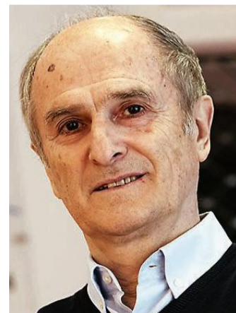
...und 2020 in seinem Sportgeschäft.

„O weh, dachte ich – schon 70?“, schreibt Cierpinski im Vorwort seines Buches „Nennt Eure Söhne Waldemar“. Auf 64 reich bebilderten Seiten schil-