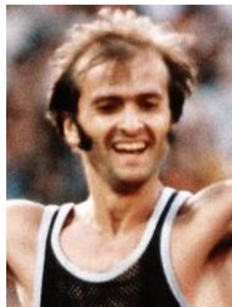
Freude: Waldemar Cierpinski 1980 ...

Ganz klar: Oertel muss beim Stichwort „Waldemar“ sofort an seine Kultstatus-Reportage der Olympischen Spiele in Moskau denken. Mit drei prägnanten Sätzen in drei Sekunden hatte er Cier-